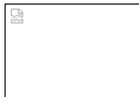
funktionales Familiensystem "getrennt lebender Eltern"

In einem gut funktionierenden Familiensystem mit getrennt lebenden Eltern ist die Grenze zwischen den Haushalten so durchlässig, dass die Kinder relativ problemlos Kontakt zu beiden Eltern haben können, wobei die Autonomie jedes Haushalts aber gewahrt bleibt.