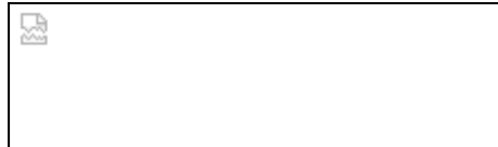
Kernfamilie(*) Familie mit getrennt lebenden Eltern (* Die Kreise stellen die Haushalte dar)

Denn steht der Trennungsentschluss fest und ein Elternteil zieht aus, dann verändert sich die Struktur der Familie: Aus einer Kernfamilie wird eine Familie mit getrennt lebenden Eltern. Vater und Mutter agieren jetzt aus zwei Haushalten heraus, die zwar autark funktionieren, aber über die Kinder, das Geld und die Vergangenheit miteinander verbunden bleiben.